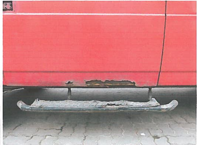
Uszkodzony próg pojazdu