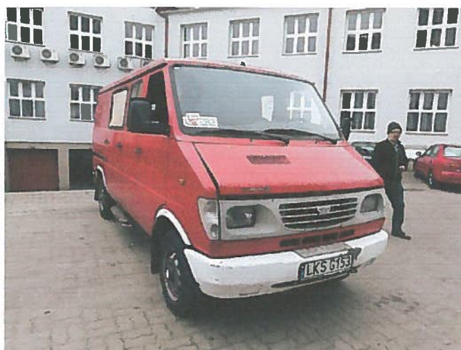
Przód i prawy bok pojazdu