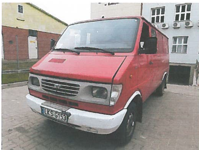
Przód i lewy bok pojazdu

Rodzaj pojazdu: Samochód ciężarowy do 3.5t