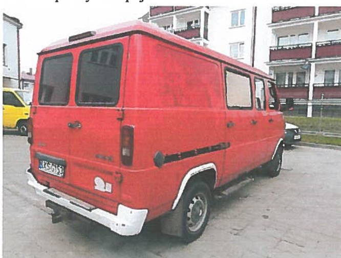
Tył i prawy bok pojazdu