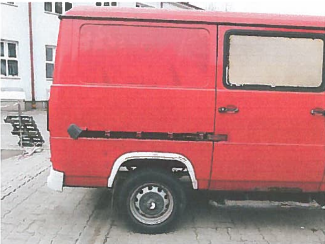
Uszkodzona listwa drzwi prawych