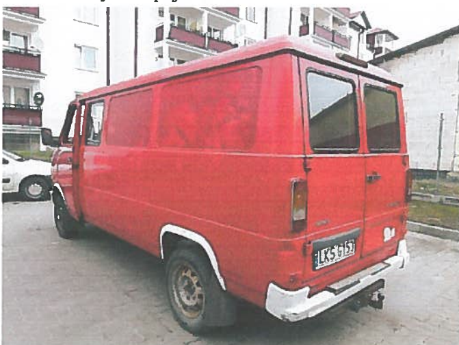
Tył i lewy bok pojazdu