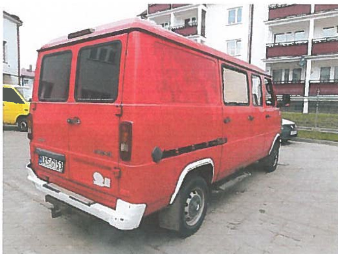
Tył i prawy bok pojazdu