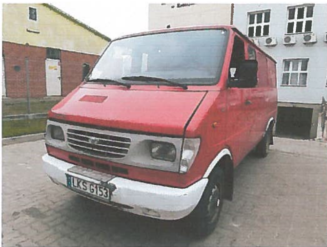
Przód i lewy bok pojazdu

Rodzaj pojazdu: Samochód ciężarowy do 3.5t