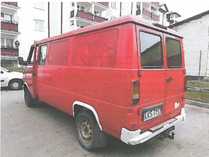
Tył i lewy bok pojazdu